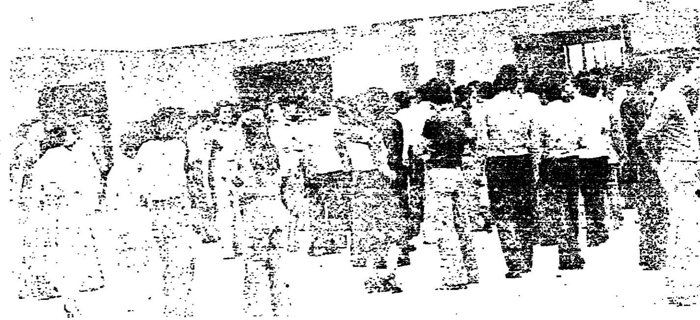
امام احد مراكز الامتحان في زحلة

زحلة - من مراسل «الانوار»: بدأت صباح أمس في زحلة امتحانات شهادة الرياضيات والعلوم الاختيارية في جو هادئ وهدوء. وكانت الاجنابات قد تسبدها قوات صربية من السورج، وللتنفيل عند وتاد سرية زحلة، ويضفي ضباط قوات الردع، ورئيس دائرة التربية الوطنية في البقاع، للتحضير لهذه الامتحانات واجرائها في جو من الاستقرار والطمينة.